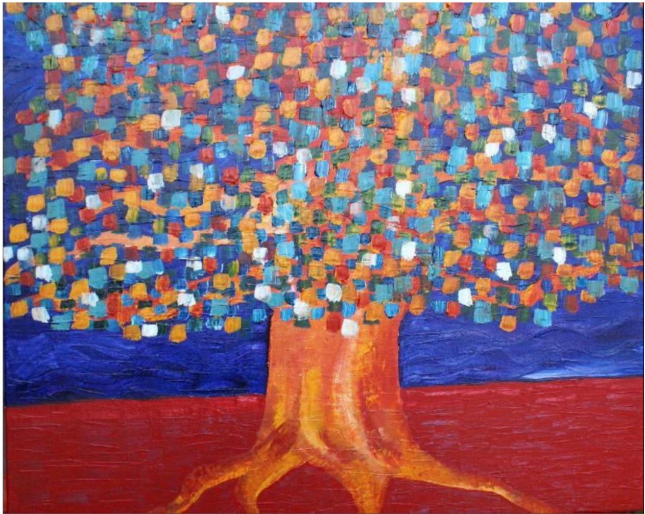
'Tree of Life' (2008), acrylverf op linnen, 90 bij 110cm

In deze tijd is het hard nodig om weer op zoek te gaan naar de 'roots' van de kunst. De kracht van schoonheid. Wat is deze kracht en wat levert het op?